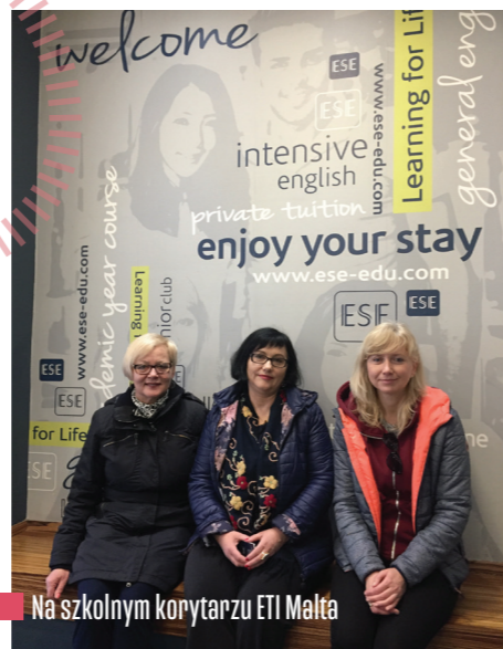
Na szkolnym korytarzu ETI Malta

Grupa 15 nauczycieli Zespołu Szkół Ekonomicznych im. Mikołaja Kopernika w Kielcach uczestniczyła w kursie języka angielskiego „Fluency and English Language Development for Teachers” w miejscowości St. Julian’s w jednej z najbardziej znanych szkół językowych dla obcokrajowców - ETI Malta. Uczestnicy kursu podnosili poziom swoich kompetencji językowych poprzez konwersacje w grupach wielonarodowościowych. W zajęciach wzięli udział Niemcy, Francuzi, Włosi, Hiszpanie, Czeccy, Ukraińcy, Rosjanie i Koreańczycy. Wśród nich byli nie tylko nauczyciele, ale także bankowcy czy biznesmeni. Zajęcia świetnie motywowały do nauki angielskiego. Wspierały