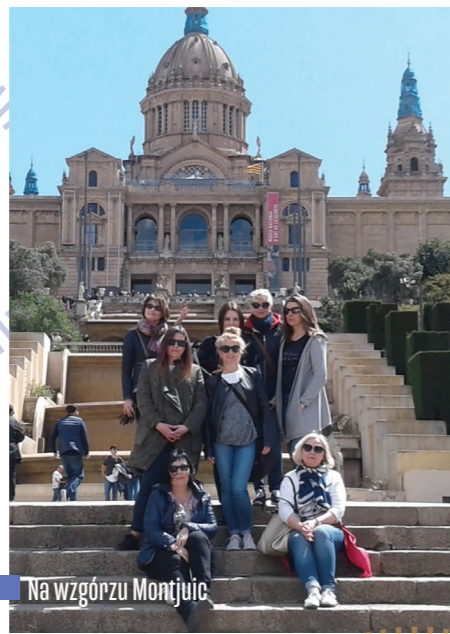
Na wzgórzu Montjuic