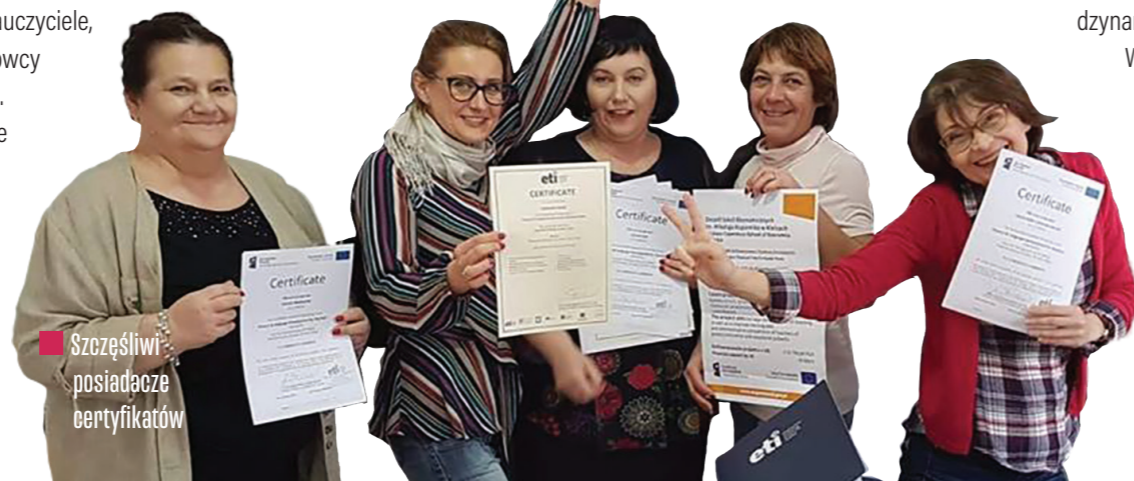
● Szczęśliwi posiadacze certyfikatów

kreatywne myślenie. Służyły kształceniu umiejętności konwersacji w języku angielskim oraz wykorzystaniu źródeł i materiałów w języku obcym. Zdecydowaną zaletą kursu było nawiązanie współpracy z nauczycielami z Włoch i Hiszpanii. Grupa miała także okazję zobaczyć atrakcje turystyczne perły Morza Śródziemnego. Wszyscy zwiedzili centrum historyczne stolicy Malty - Valletty i jej najciekawsze zabytki: Pałac Wielkich Mistrzów, Teatr Manoela, Muzeum Wojny oraz konkatedrę św. Jana. W tej ostatniej